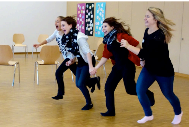
Mädchen der Oberstufe schreien und rennen voller Kraft