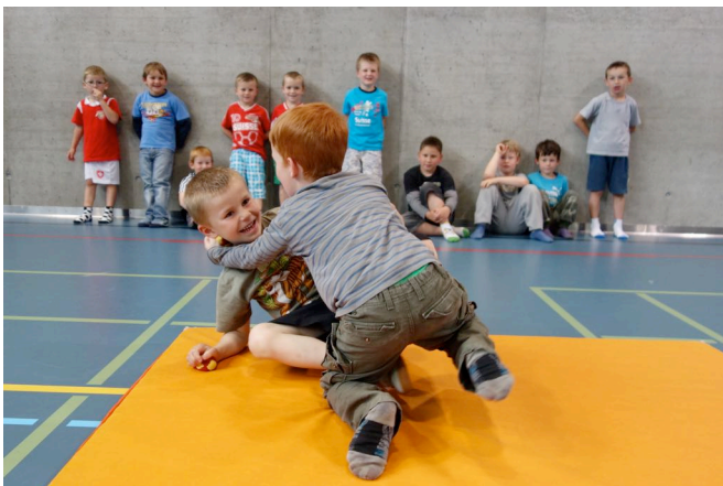
Buben streiten fair um Bälle

Saal. Dünne Matten und weiteres Material werden von «echtstark» zur Verfügung gestellt.