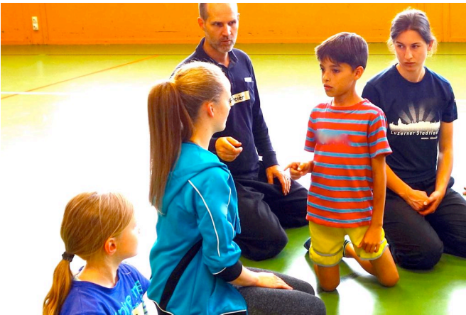
Konzentration und Ernsthaftigkeit beim Neinsagen

Zu Übungszwecken vermittele ich verschiedene Intensitäten von Neinsagen. Diese sind: Mikronein, kleines Nein, grosses und übergrosses Nein.