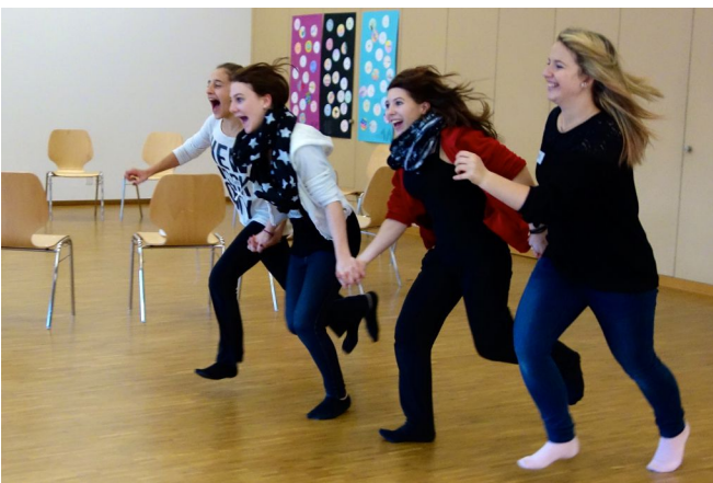
Mädchen der Oberstufe schreien und rennen voller Kraft