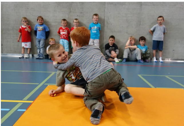
Buben streiten fair um Bälle

Saal. Dünne Matten und weiteres Material werden von «echtstark» zur Verfügung gestellt.